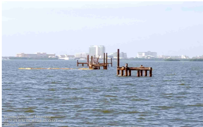
Puente Vehicular Nichupté 21°7'24.6"N 86°47'23.35"O (±1m) Altitud: -29m

Actividad: Colocación de armado de acero de refuerzo primera sección en pila de cimentación número 03 del apoyo 139.