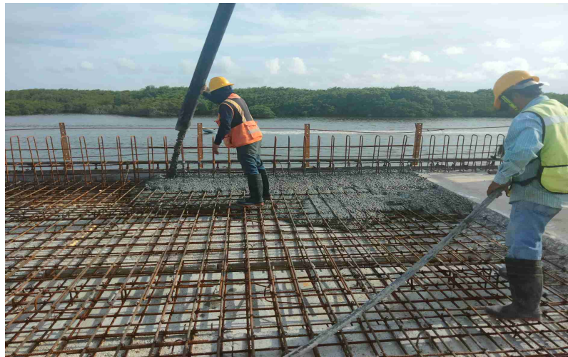
Ubicación: LOSAS DE CALZADA / T4 TAB074-075 LC Actividad: Inicia colado de losa de calzada claro 74.5-75.5, tramo 4 zona lagunar.