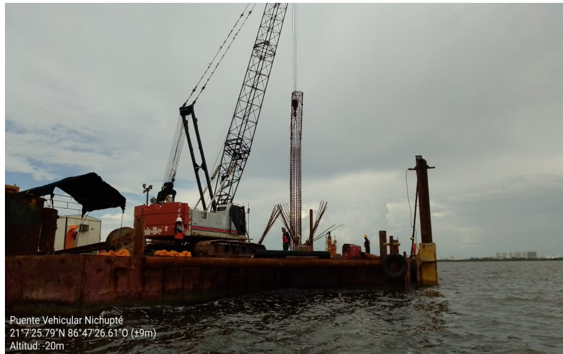
Puente Vehicular Nichupté 21°7'25.79"N 86°47'26.61"O (±9m) Altitud: -20m