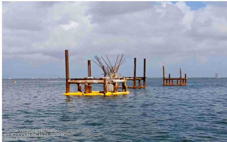
Puente Vehicular Nichupte 21°6'21.71" N 86°46'21.32" O (±2m) Altitud: 9m