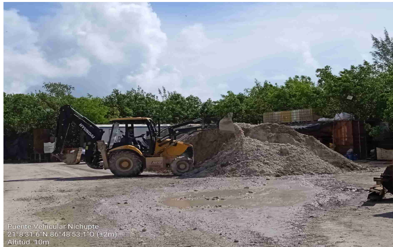
Puente Vehicular Nichupte 21° 8' 31.6" N 86° 48' 53.1" O (±2m) Altitud: 10m