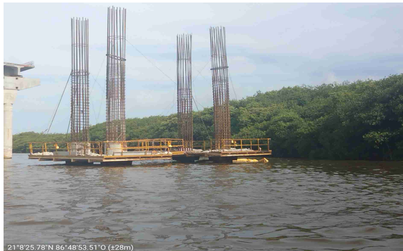
Ubicación: PILA Y COLUMNA 001 / T3 A60 P01 Actividad: Se inicia el armado de acero de refuerzo en columnas del apoyo 60, tramo 3 zona top down